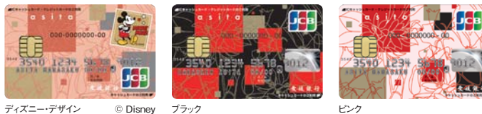
ディズニーデザイン

※1.ゴールドカードは対象となりません。 ※2.カード有効期限月の翌月10日より適用となります。