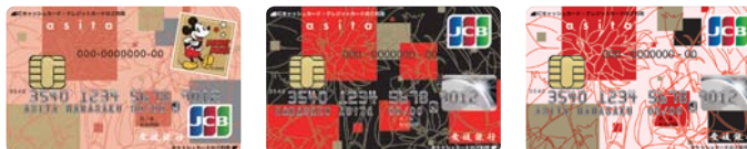
ディズニー・デザイン © Disney ブラック ピンク