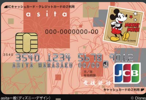
asita一般(ディズニー・デザイン) © Disney