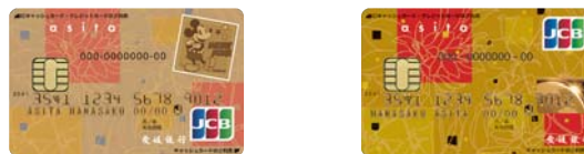
ディズニー・デザイン © Disney 通常デザイン