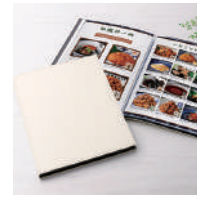
おうちレストラン アランホワイト

※投資信託は店頭でのお申込に限ります。 ※外貨定期預金のお預入れ金額は、お預入れ時の円換算額といたします。 ※ATMで定期預金をお預入れいただいたお客さまは、窓口にお知らせください。 ※写真はイメージです。実際の商品と異なることがあります。