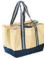
ECOクーラーレジバック