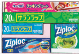
旭化成 サランラップバラエティギフト15