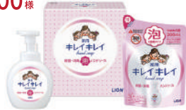
キレイキレイ 泡ハンドソープセット