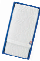
今治白小浪ジャガード フェイスタオル