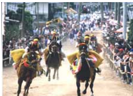
平成 22 年 10 月助成 菊間町愛馬会の活動

財団法人愛媛銀行ふるさと振興基金は、愛媛銀行の創立 40 周年を記念して、昭和 58 年に設立したものです。愛媛県内における産業経済の発展に寄与する産業活動又は文化活動に対して、顕彰事業及び助成事業を継続して行うことにより、ふるさとへの振興に寄与しているものです。このたび、国の公益制度改革に対応するため、平成 22 年 9 月 17 日より公益財団法人愛媛銀行ふるさと振興基金へ移行いたしました。