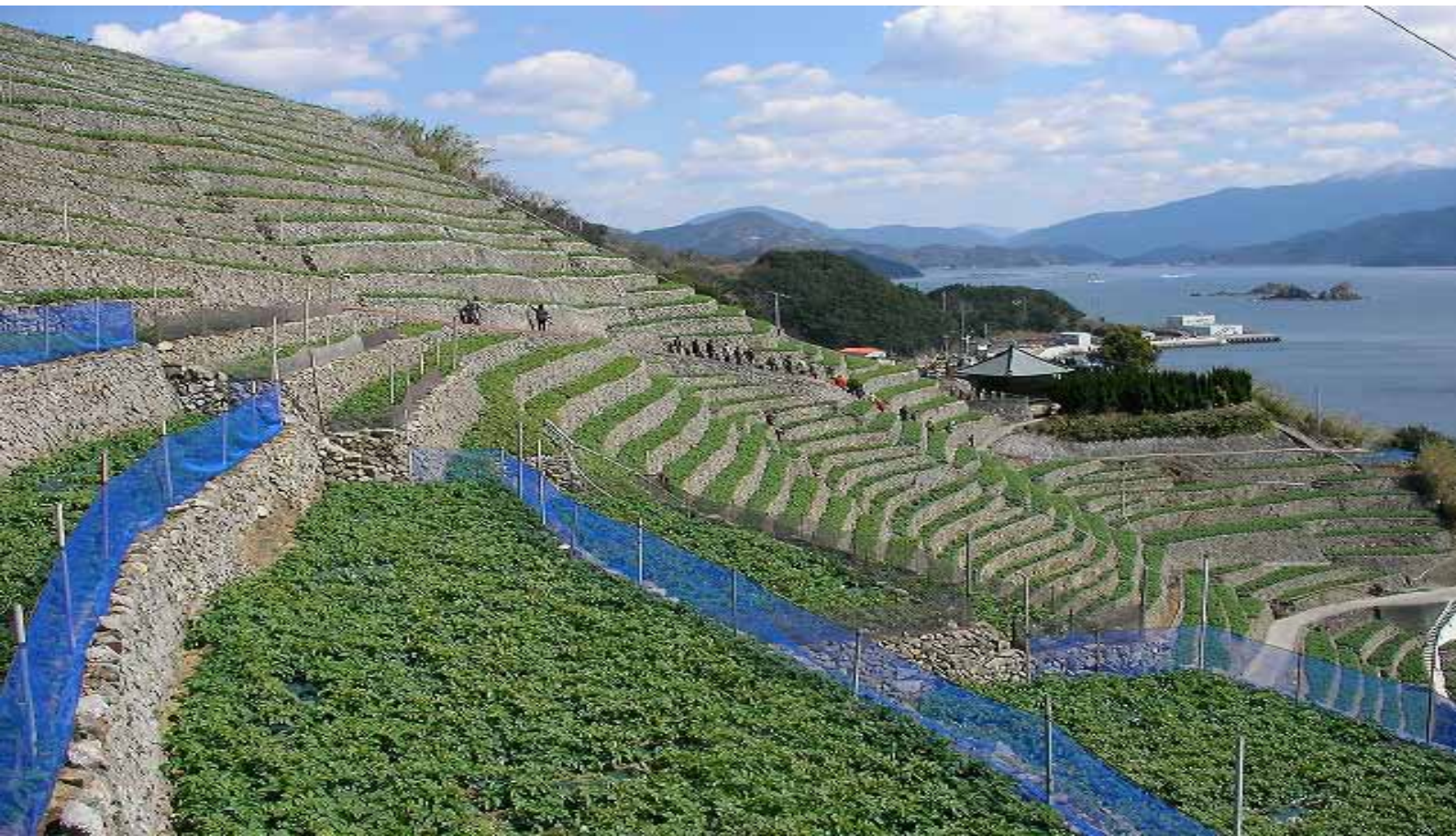
宇和島市遊子水荷浦の段畑